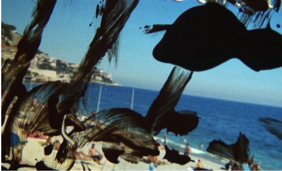
Laure Prouvost, Wantee , 2013.

Ett verk som Years of Thinking in Common (2012) utgår från Villa Charleston där många i Bloomsburygruppen levde sina liv, och där allt i huset är dekorerat från golv till tak. Ett annat verk, Gifts and Occupations (2016), tar fasta på Friedrich Fröbel som var upphovsmannen till kindergarten, barnträdgården. Frøbels pedagogik går ut på att låta barnen komma i kontakt med abstrakt material för att lära sig om sig själva och sin omgivning.