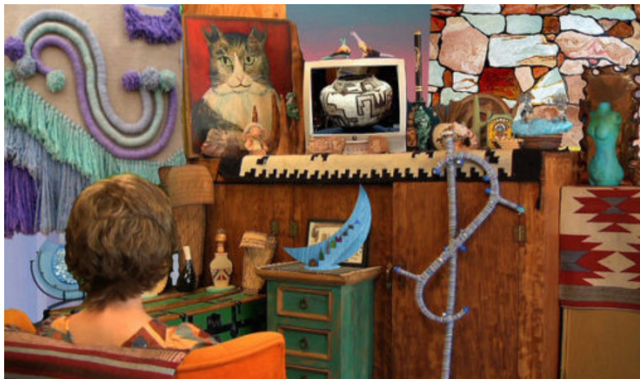
Shana Moulton, Whispering Pines (stillbild), 2002--.

Kopplingen mellan material och samhälle är något som vi har intresserat oss för länge. Vi gjorde till exempel ett projekt som utgick från Josef Albers workshops vid Bauhaus och Black Mountain College, där studenterna interagerade med olika material för att lära sig att se. Albers arbetade med väldigt enkla material men talade om dem i sociala termer. Detta är en ingång vi har till väldigt mycket: att abstrakt form kan säga mycket om det sociala och det samhälleliga.